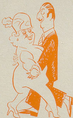
«Schöner Gigolo, armer Gigolo...»