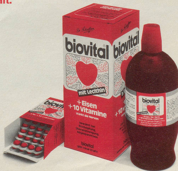
Zutt • Arnold

Biovital enthält 10 lebenswichtige Vitamine, biologisch-aktives Eisen und rein pflanzliches Lecithin. Alles in wohlausgewogenen Mengen. ● Deshalb gibt Biovital neue Kraft. Es hilft bei allgemeiner Müdigkeit und Erschöpfung. Bei Appetitlosigkeit, Konzentrationsschwäche und Nervosität. ● Sie bekommen Biovital in allen Apotheken und Drogerien. Als Biovital flüssig und in der praktischen Dragéeform. ● Biovital gibt neue Kraft.