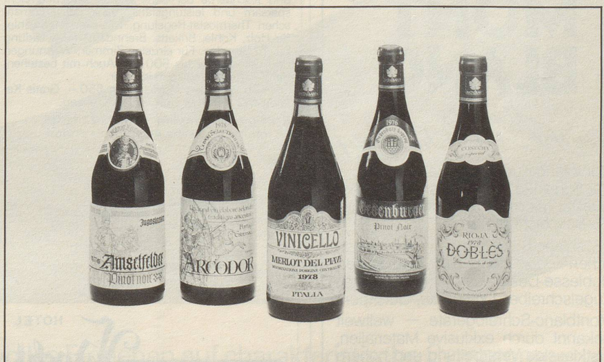
Die in Ljubljana seit 5 Jahren ausgezeichneten Weine mit dem goldenen Rebenblatt (v.l.n.r.): Amselfelder (Jugoslawien), Dobles (Spanien), Arcodor (Portugal), Oedenburger (Ungarn), Vinicello (Italien).

schungen erbringt die alljährlich stattfindende Weinmesse in Ljubljana, wo Weine aus ganz Europa von international anerkannten Weinexperten gestrenge Tests unterzogen werden. So wurden beispielsweise die vom Schweizer Weinhaus Bataillard in Rothenburg LU eingereichten Weine in den letzten fünf Jahren mit nicht weniger als 10 Goldmedaillen und 11 Silbermedaillen ausgezeichnet. Diese Weine – sie werden aus Spanien, Italien, Portugal, Jugoslawien und Ungarn importiert – tragen am Flaschenhals ein goldenes Rebenblatt, das Zeichen für qualitativ hochstehende, doch preiswerte Weine. Zudem sind die Weine mit dem goldenen Rebenblatt eine echte Alternative zu unseren knappen und somit teuren Schweizer Weinen.