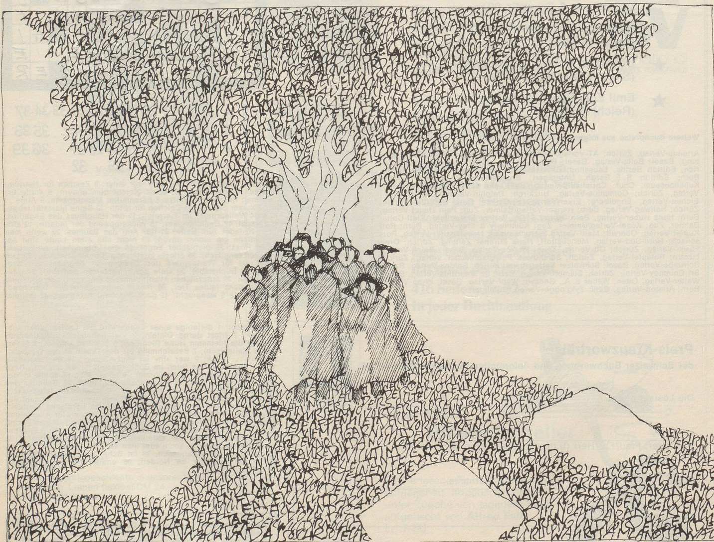
PAUL FLORA: DICHTERTREFFEN AUF DEM PARNASS

Konkret hat man sich das etwa folgendermassen vorzustellen: Die Bücher werden auf ein spezielles Papier gedruckt, das aus einem dünn ausgewalzten Teig be-