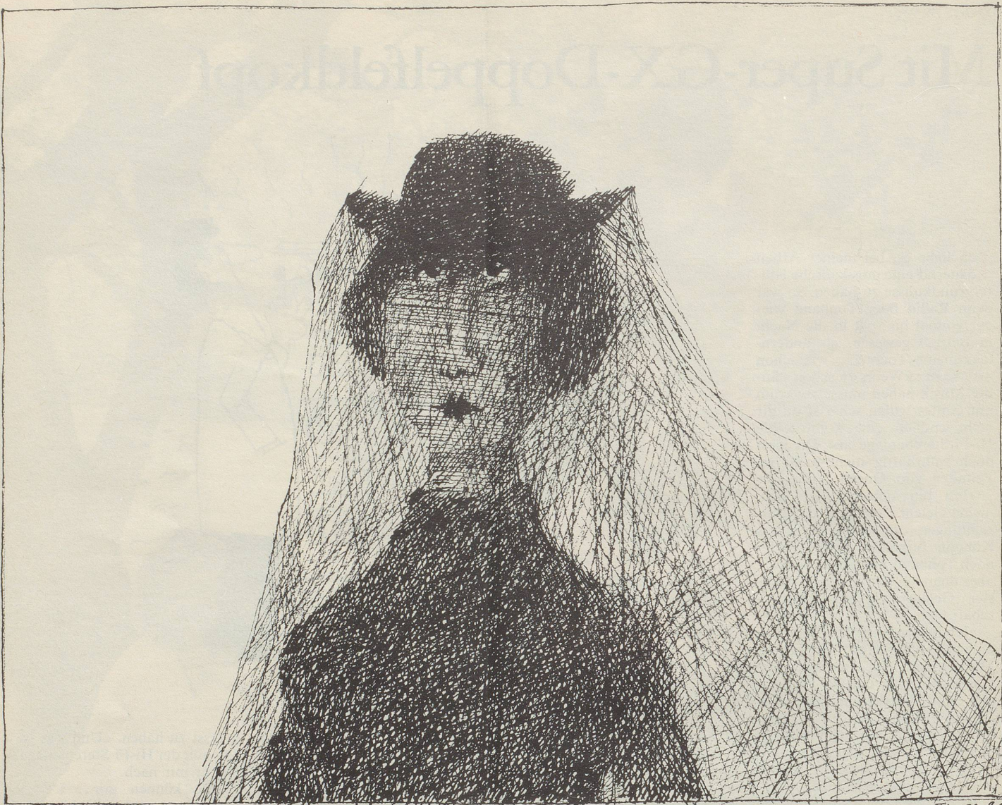
Paul Flora: Die Witwe