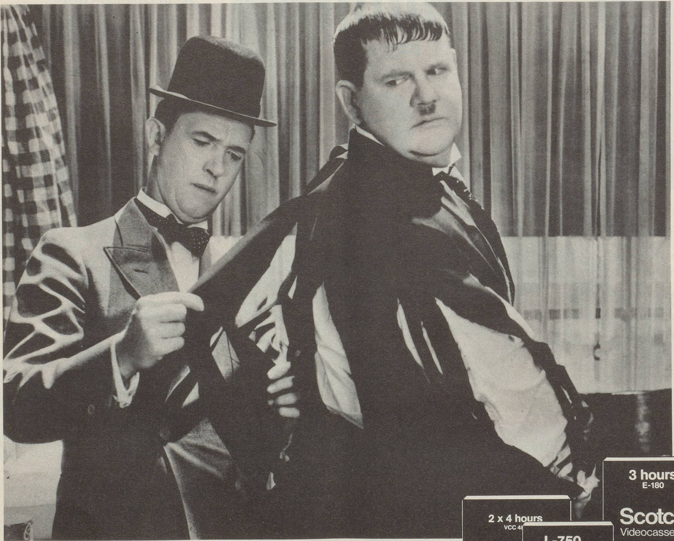
Die mit den farbigen Streifen – für Liebhaber videologisch.

Wer sich Video ab Scotch Cassetten zu Gemüte führt, hat gut lachen. Das gestochen scharfe, farbechte Bild gereicht jeder Aufzeichnung zur Auszeichnung. Dafür garantiert Scotch, weltweit Nummer eins im Video. Um wirklich alle Bildschirm-Nebel zu spalten, stellt Scotch für jedes System die passende Video-Cassette her. Verlangen Sie ausdrücklich danach: Sie werden sehen, wie sehr es sich lohnt!