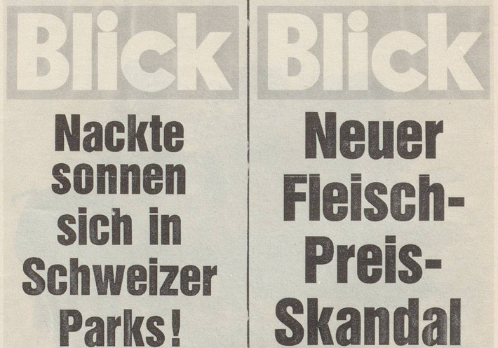
Diese zwei Aushangplakate sah ich am 19. August 1981 an einem Zürcher Kiosk. A. Bärlocher, Zürich

Me muess halt rede mit de Lüüt? Schon recht. Aber wer hört uns eigentlich noch zu? Es lebe die Indifferenz! Die Elektronik macht's wieder einmal möglich.