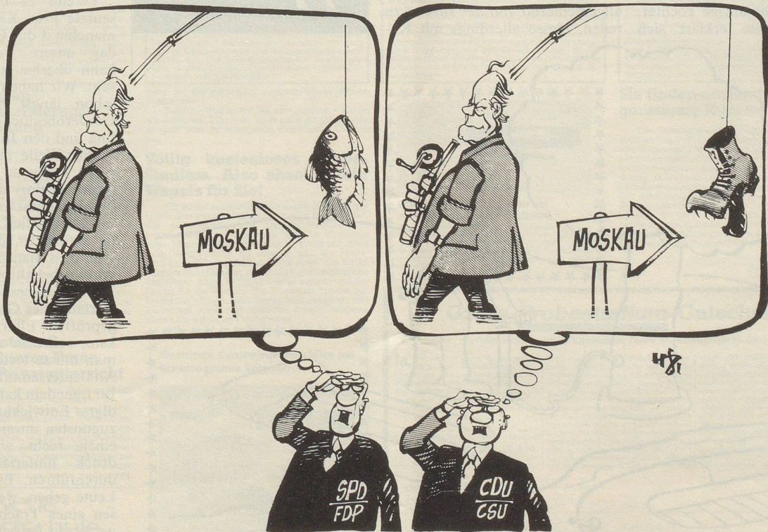
«Sie sollten einmal zum Augenarzt gehen, Herr Kollege!»