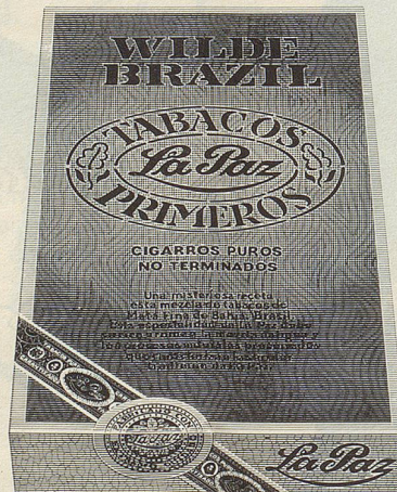
Wilde Havana und Wilde Brazil von La Paz Die oft kopierte, doch nie erreichte Wilde. Einzigartig im Aroma. Aus Tabak, mehr nicht. 5 Stück Fr. 3.—