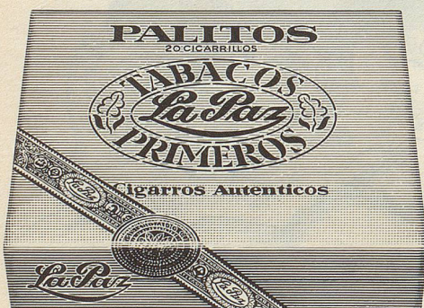
Cigarillos Palitos von La Paz Einfach und gut. Gehaltvolle Cigarillos für jede Tageszeit. Viel Aroma für wenig Geld. 20 Stück nur Fr. 4.80