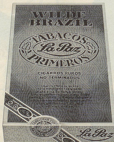
Wilde Havana und Wilde Brazil von La Paz Die oft kopierte, doch nie erreichte Wilde. Einzigartig im Aroma. Aus Tabak, mehr nicht. 5 Stück Fr. 3.—