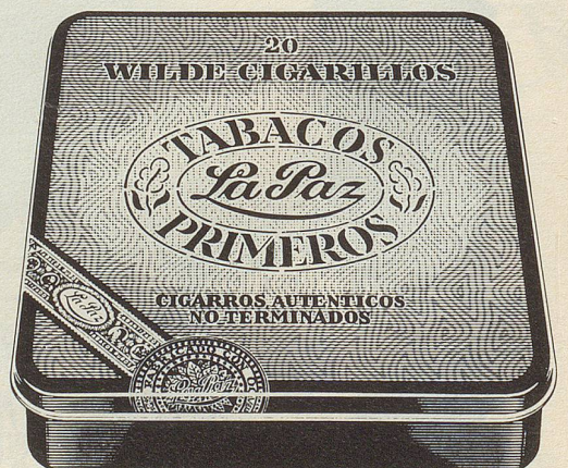
Wilde Cigarillos Havana- und Brazil-Type von La Paz Die ehrlichen Wilden Cigarillos aus reinem, unverfälschtem Tabak. 20 Stück Fr. 8.—

Wenn Sie noch mehr über La Paz erfahren möchten, verlangen Sie bitte mit einer Postkarte die interessante Broschüre «Die Cigarre» direkt beim Importeur Säuberli AG Basel, Postfach, 4002 Basel.