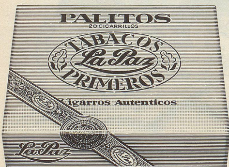
Cigarillos Palitos von La Paz Einfach und gut. Gehaltvolle Cigarillos für jede Tageszeit. Viel Aroma für wenig Geld. 20 Stück nur Fr. 4.80