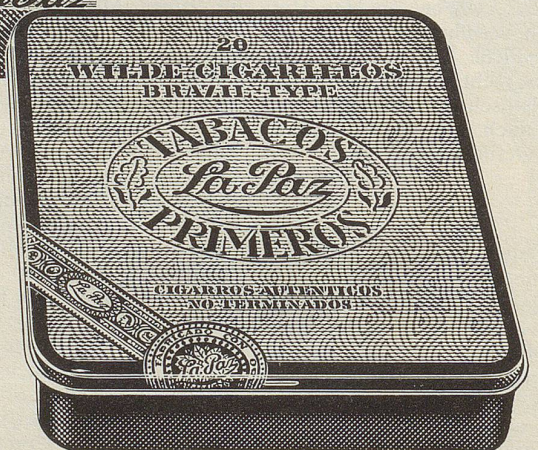
Wilde Cigarillos Brazil-Type von La Paz 20 Stück Fr. 8.—