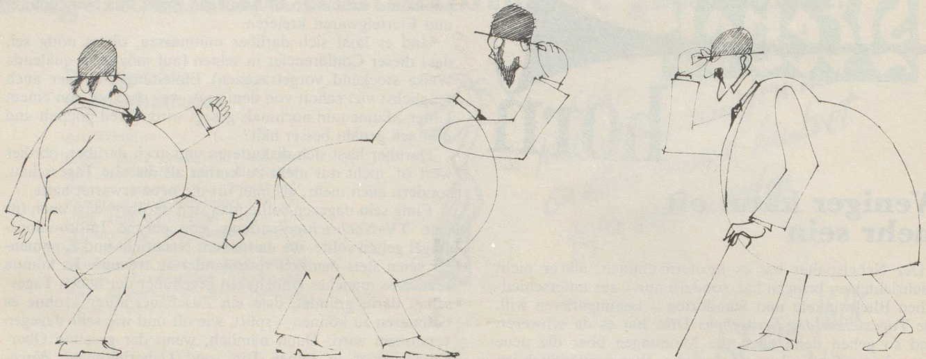
Unverhofft kommt oft