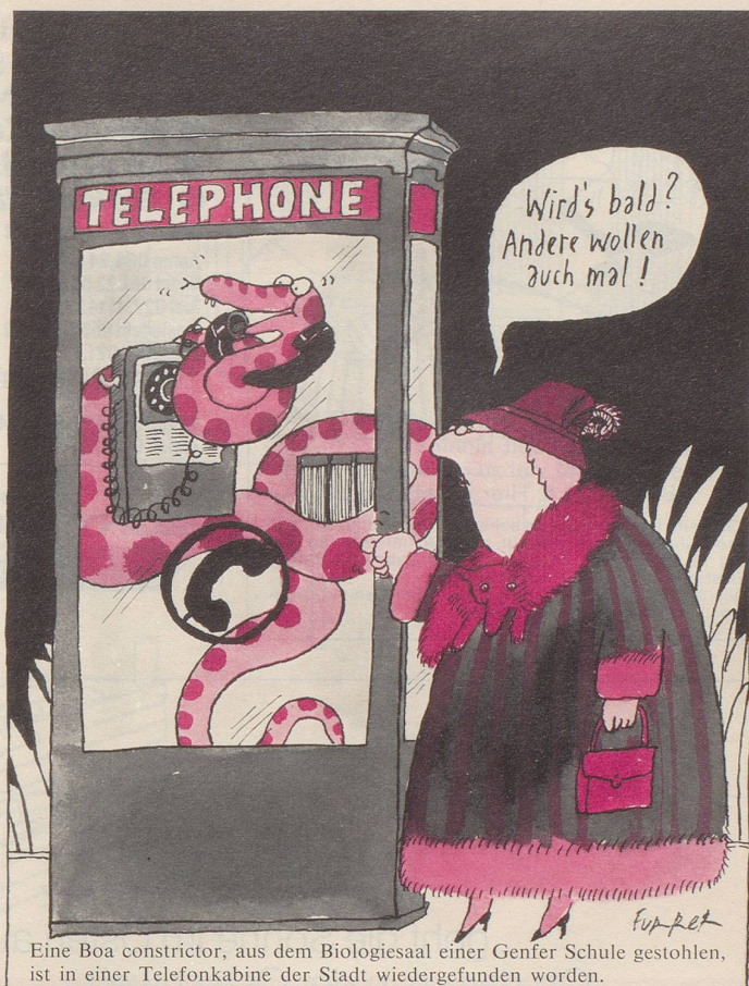
Eine Boa constrictor, aus dem Biologiesaal einer Genfer Schule gestohlen, ist in einer Telefonkabine der Stadt wiedergefunden worden.

«Es kommt noch und nöcher vor» (um mit einem «Moderator» am Radio zu reden), dass man nichts mehr schliesst, verschliesst oder abschliesst. Alles «wird dichtgemacht» in unserer Zeit. Warum, weiss niemand, so gut wie niemand zu sagen weiss, wie das Wort «Moderator» und «das Moderieren» entstanden sind. Niemand? Fridolin