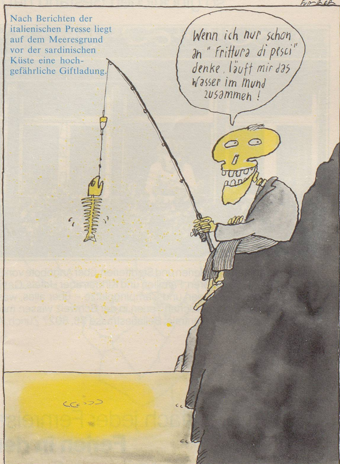
Nach Berichten der italienischen Presse liegt auf dem Meeresgrund vor der sardinischen Küste eine hochgefährliche Giftladung.