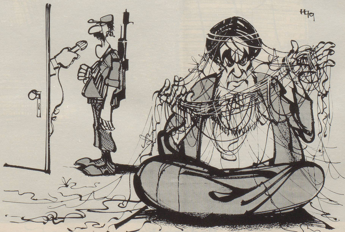
«Keine Sorge, der Ayatollah hat die Fäden fest in der Hand.»