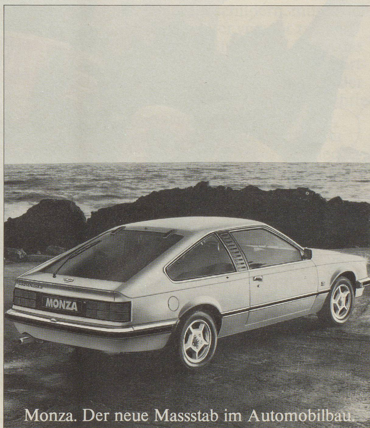
Monza. Der neue Massstab im Automobilbau.