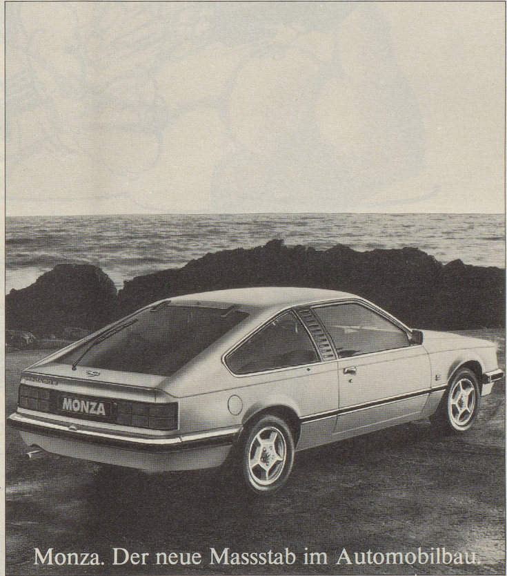
Monza. Der neue Massstab im Automobilbau.