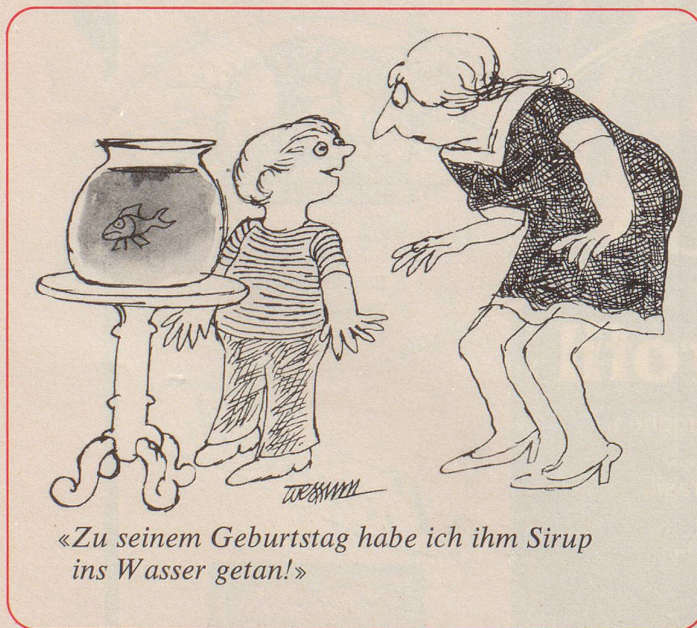
«Zu seinem Geburtstag habe ich ihm Sirup ins Wasser getan!»

Ein jüngerer SBB-Mann erschien, öffnete einen Wandschrank und rumorte darin herum. «Hattest du Erfolg?» fragte