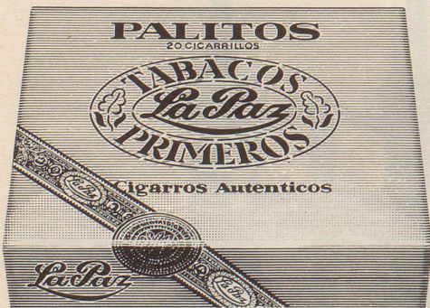
Cigarillos Palitos von La Paz Einfach und gut. Gehaltvolle Cigarillos für jede Tageszeit. Viel Aroma für wenig Geld. 20 Stück nur Fr. 4.80