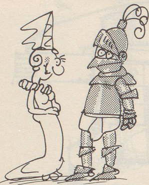
Eisern bleiben und JSA tragen.