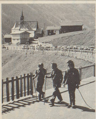
«Region Oberalp, wo Ferien noch Ferien sind!»

Ein Wanderparadies im Herzen der Schweiz wurde gesucht. 4013 richtige Lösungen sind eingesandt worden: