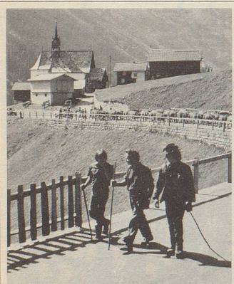
«Region Oberalp, wo Ferien noch Ferien sind!»

Ein Wanderparadies im Herzen der Schweiz wurde gesucht. 4013 richtige Lösungen sind eingesandt worden: