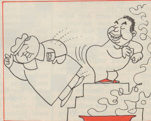
... Mao ist ...