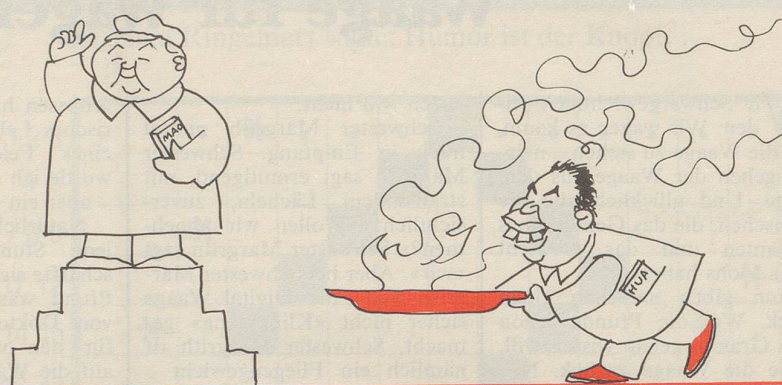
Der grosse ...