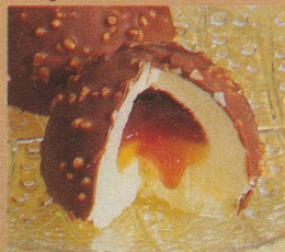
Iglou Caramel Knusprige Schale, süßer Kern. Eine Frisco Spezialität.