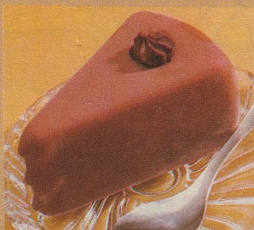
Frisco Tourte Hélène Praktischer geht's nicht: Vier Einzelstücke feinster Mocca-Glace-Torte.