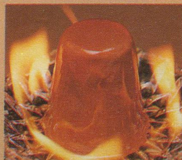
Frisco Parfait Mocca Anzünden und Feuer fangen für den unvergleichlichen Glace-Spass.

Sultaninen ein kräftiges Aroma und dem Entdecker einen Hauch aus der Karibik auf die Zungenspitze. Dieses Erlebnis ist zu schade, um alleine genossen zu werden. Iglou Jamaïque. Die einzige Rumsultaninensauce mit Frisco-Glace drumherum.