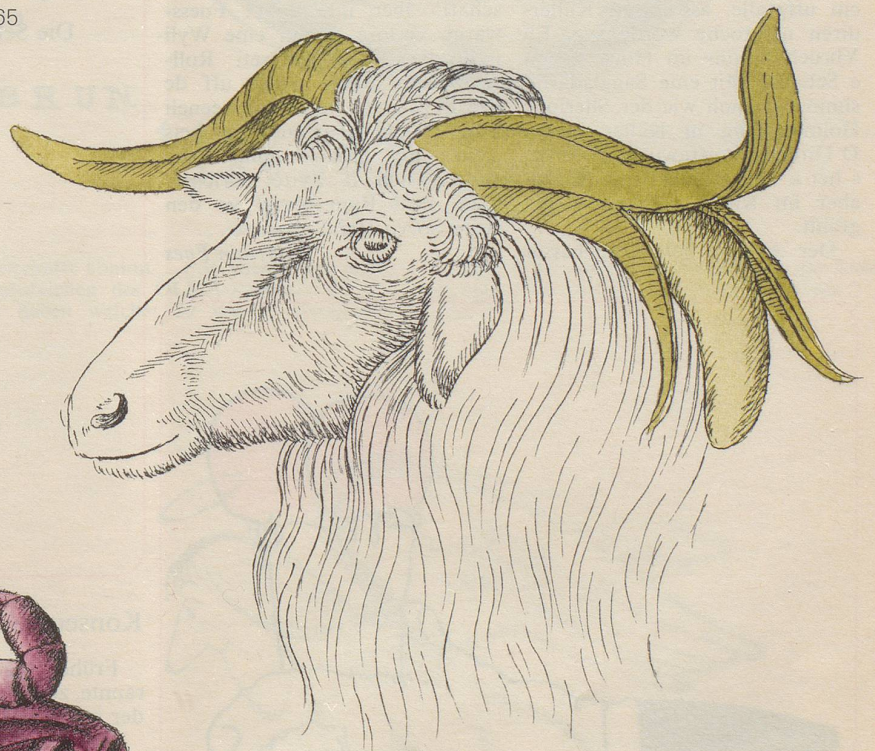
Antonio Pisanello Kopf des Widders