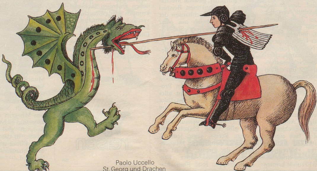
Paolo Uccello St. Georg und Drachen