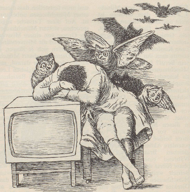
Francisco Goya Der Traum der Vernunft gebiert Ungeheuer (Caprichos 43)