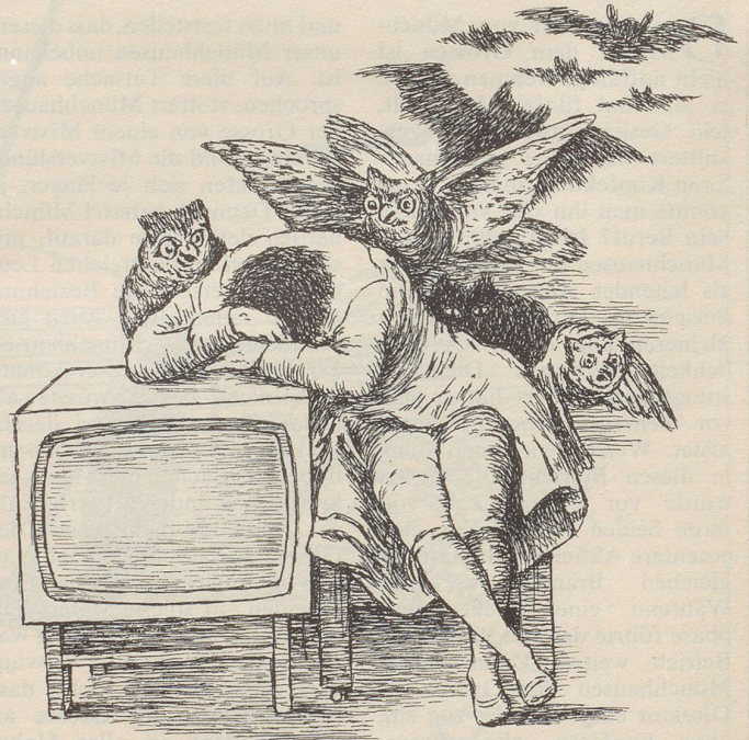
Francisco Goya Der Traum der Vernunft gebiert Ungeheuer (Caprichos 43)