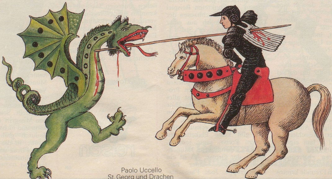
Paolo Uccello St. Georg und Drachen