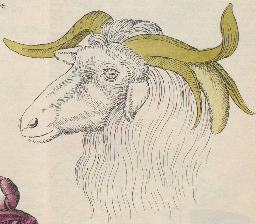
Antonio Pisanello Kopf des Widders