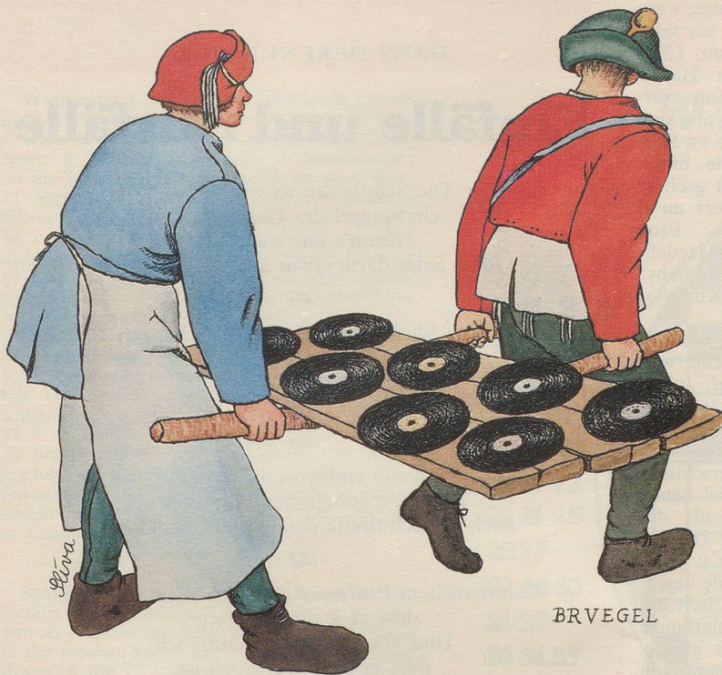
Pieter Bruegel Bauernhochzeit (Ausschnitt), 1565