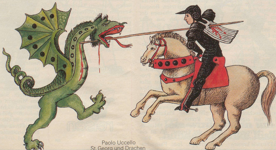
Paolo Uccello St. Georg und Drachen