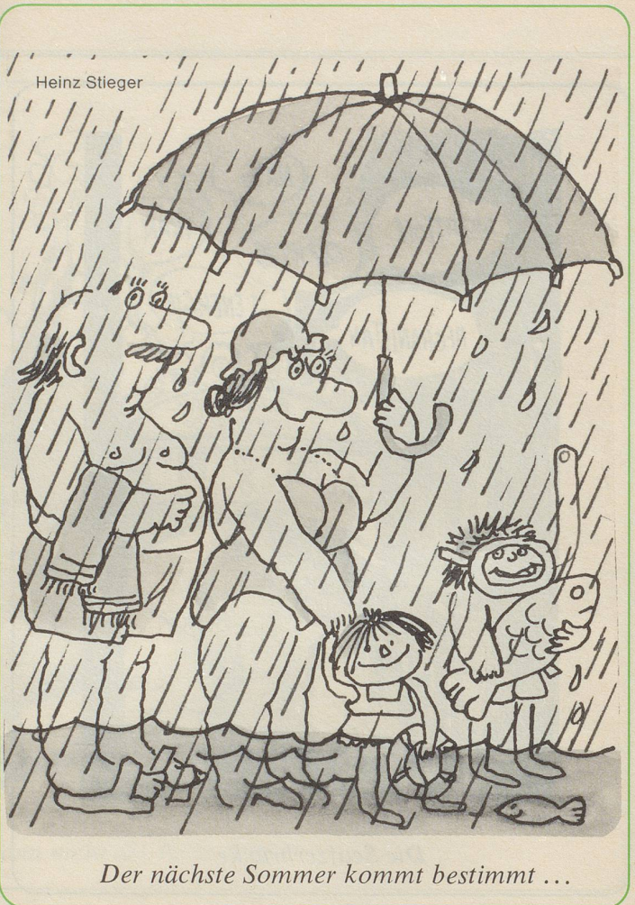
Der nächste Sommer kommt bestimmt ...