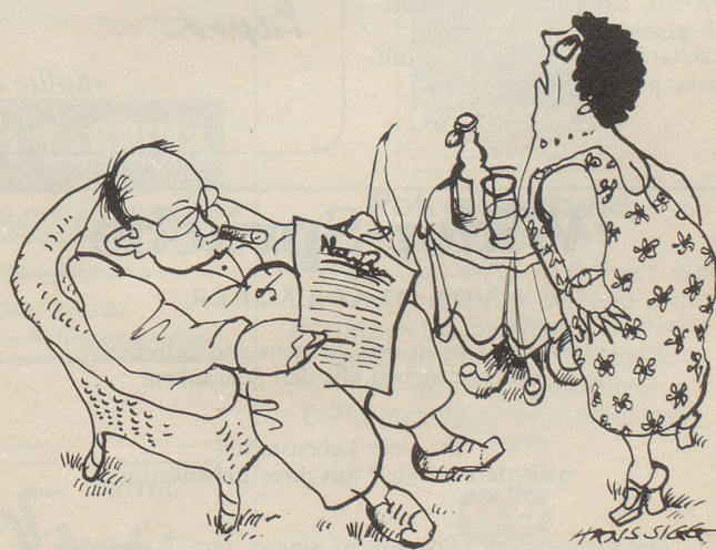
«Reg dich doch nicht so auf – doch wieder falscher Alarm!»