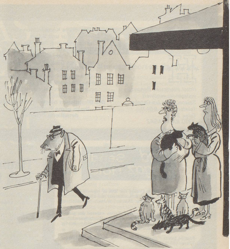
«Er hat etwas gegen Katzen.»