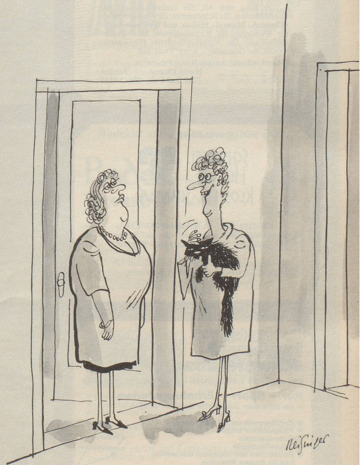
«Mein Möhrli möchte Ihren Hansi kennenlernen.»