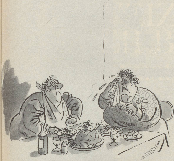
«Das arme Tier – aber so wunderbar knusprig!»