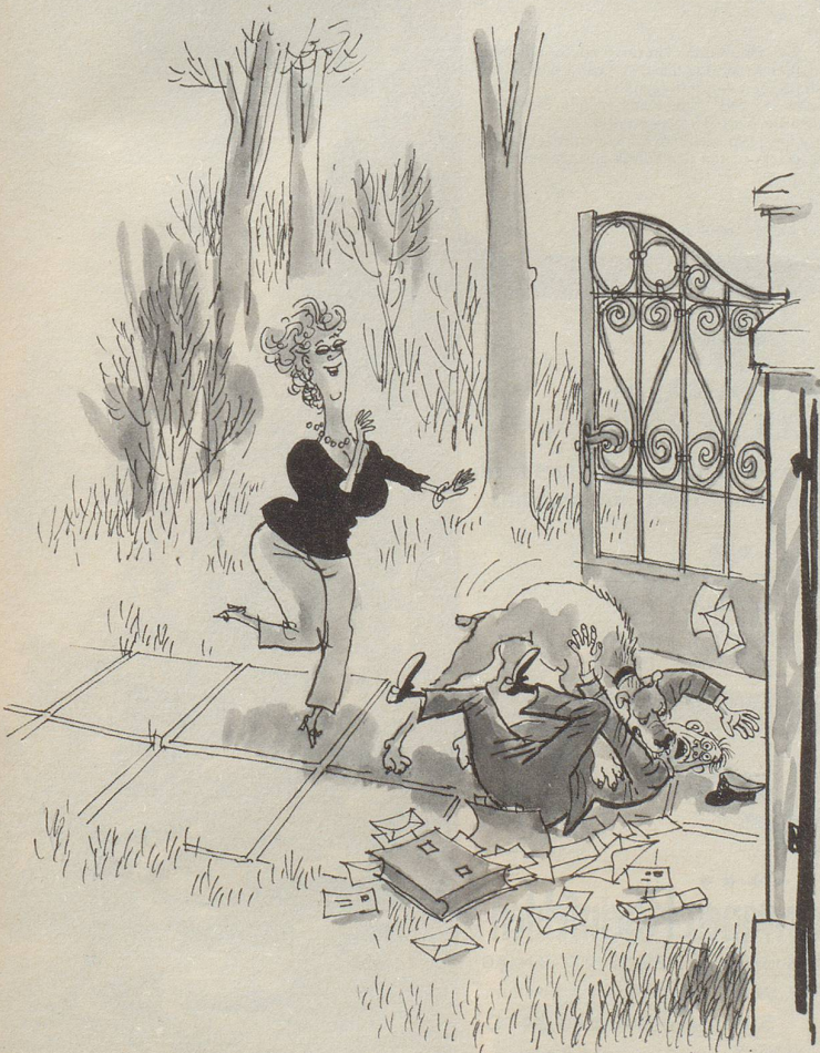
«Zurück, Hektor – der Onkel bringt nur die Post!»