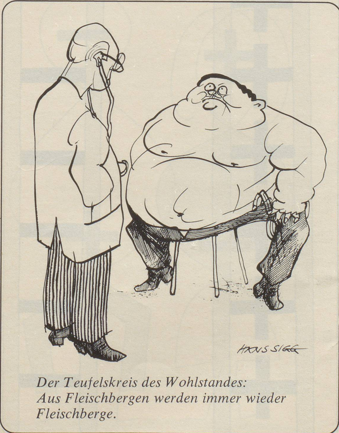
Der Teufelskreis des Wohlstandes: Aus Fleischbergen werden immer wieder Fleischberge.

Enttäuscht wandte ich mich deshalb vom ZDF-Spektakel ab und geriet dabei auf die nunmehr in den Nächten zumindest in bezug auf die Sendezeit konkurrenzfähige Leutschenbacher Welle – und damit vom Regen in die Traufe. Denn hier krabbelte es gleichermassen auf der Bühne, nur mit dem Unterschied, dass sich die Ameisen zeitweilig zu einem Tausendfüssler verdichteten. Ausserdem kam das Ballett nicht aus Hamburg, sondern aus Basel. Und die Musik war nicht von Franz Schubert, sondern von George Gruntz. Telespalter