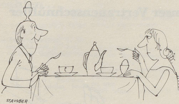
«Gell! I bi en Loschtige!»

Nachdem die Besitzer die Hunde voneinander getrennt und wieder an die Leine genommen haben, erklärt das Mädchen, welchem der irische Setter gehört: «Wissen Sie, mit diesem Hund muss man Nachsicht haben, er hat eine schwere Kindheit gehabt.»