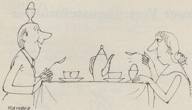
«Gell! I bi en Loschtige!»

Nachdem die Besitzer die Hunde voneinander getrennt und wieder an die Leine genommen haben, erklärt das Mädchen, welchem der irische Setter gehört: «Wissen Sie, mit diesem Hund muss man Nachsicht haben, er hat eine schwere Kindheit gehabt.»