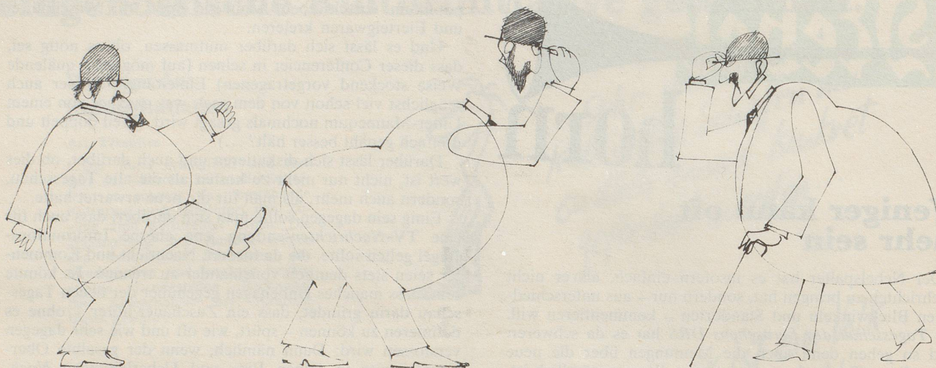
Unverhofft kommt oft