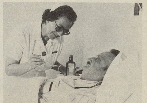
Oft genügen bereits wenige Löffel Zellerbalsam und die beruhigende Wirkung auf Magen und Darm wird spürbar.