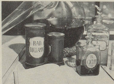
Weissdorn, Hopfen, Baldrian und Passiflora (Passionsblume) ...seit Jahrhunderten wird ihre schlaffördernde Kraft beobachtet.

Leiden Sie unter nervösen Herzbeschwerden? Sind Sie leicht reizbar? Peinigen Sie nervöse Atemnot und Angstgefühle? Eine Pflanzenkur mit Zeller Herz- und Nerventropfen kann Ihnen helfen. Dieses bewährte Heilmittel verdankt seine beruhigende und krampflindernde Wirkung Heilpflanzen, die einander harmonisch ergänzen. Die wichtigsten Bestandteile sind Extrakte aus Weissdorn und Passiflora. Zeller Herz- und Nerventropfen können über längere Zeit eingenommen werden.