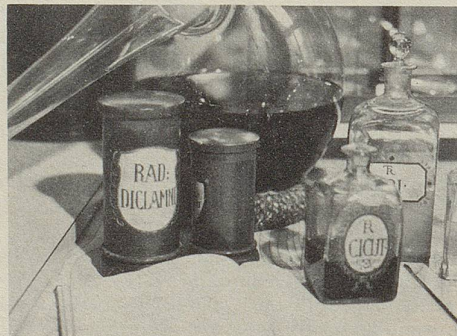
Weissdorn, Hopfen, Baldrian und Passiflora (Passionsblume) ...seit Jahrhunderten wird ihre schlaffördernde Kraft beobachtet.