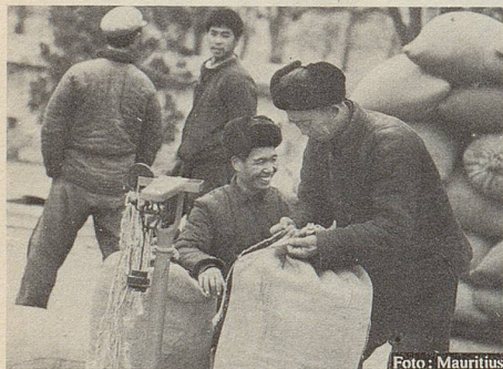
Versteigerung heilkräftiger Kräuter auf einem orientalischen Markt