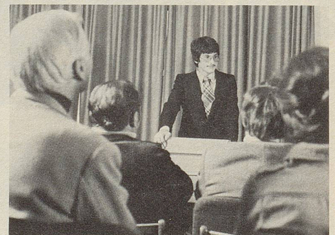
Momente höchster nervlicher Spannung: Der erste Vortrag. Da bewähren sich Zeller Entspannungs-Dragees