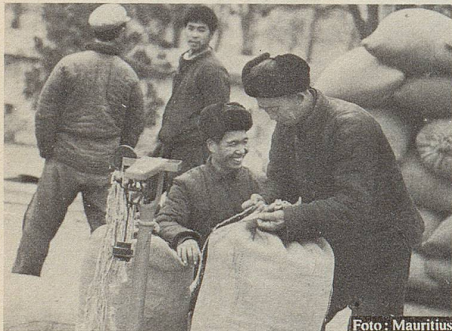
Versteigerung heilkräftiger Kräuter auf einem orientalischen Markt