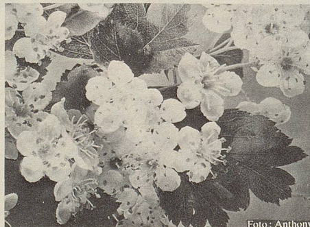
Auszüge aus Blüten und Blättern des Weissdorn geben Zeller Herz- und Nerventropfen ihre Heilkraft