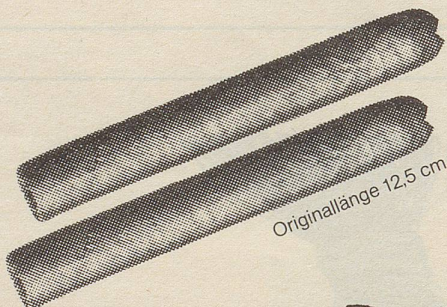
Originallänge 12,5 cm