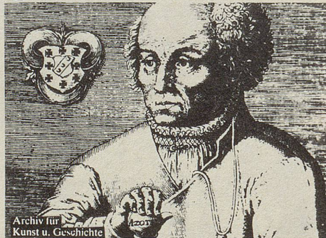
Theophrast von Hohenheim, gen. Paracelsus, der grosse Arzt und Naturforscher, kannte und nutzte die Heilkraft der Kräuter.