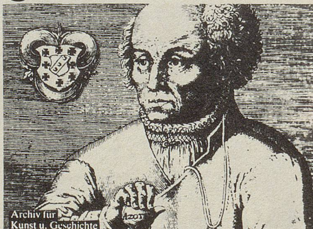
Archiv für Kunst u. Geschichte