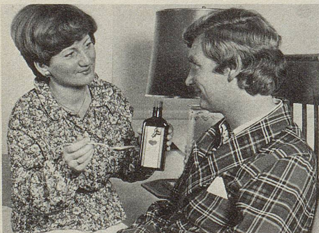
Der Rat des Arztes ist nicht zu ersetzen. Das gilt auch für die Medikation von Herz- und Kreislaufbeschwerden.