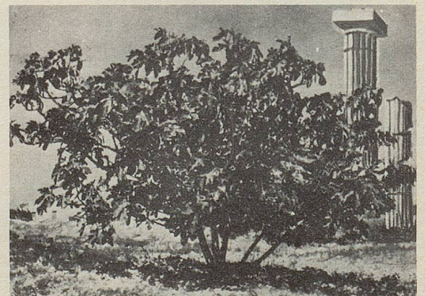
Schon im alten Griechenland kannte und schätzte man die mild abführende Wirkung der Feige.