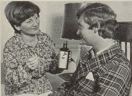
Der Rat des Arztes ist nicht zu ersetzen. Das gilt auch für die Medikation von Herz- und Kreislaufbeschwerden.