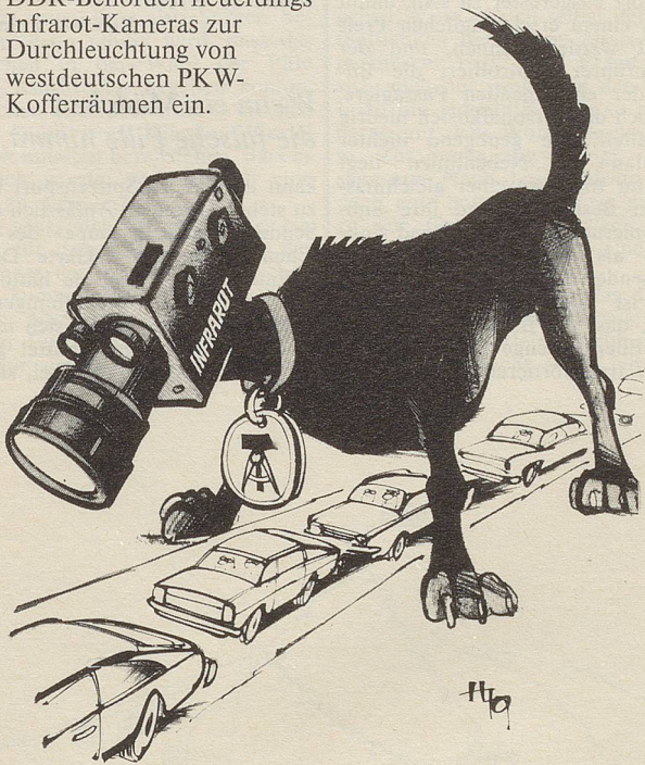
Der neueste DDR-Spürhund

Um die Flucht aus der DDR zu erschweren, setzen die DDR-Behörden neuerdings Infrarot-Kameras zur Durchleuchtung von westdeutschen PKW-Kofferräumen ein.