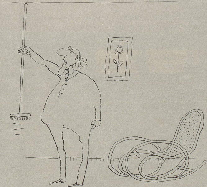
mit diesen Konkubinättern! »