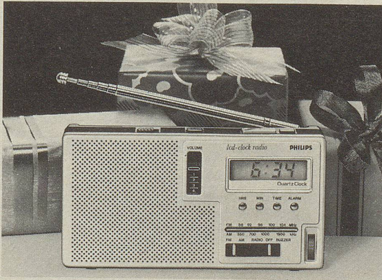
Reiseclock AS 300 Fr. 129.- inkl. Leder-Etui