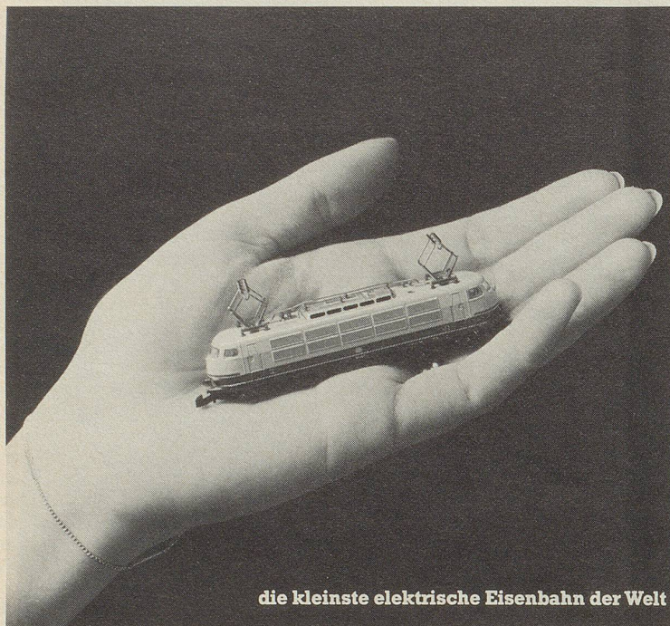
die kleinste elektrische Eisenbahn der Welt

Bei der kleinsten elektrischen Eisenbahn der Welt, der Märklin mini-club, kommen Männer ins Schwärmen. Faszinierend klein und doch eine ausgereifte, vollwertige Modellbahn. Bis ins kleinste Detail. Bis zur echten Oberleitungsfunktion.