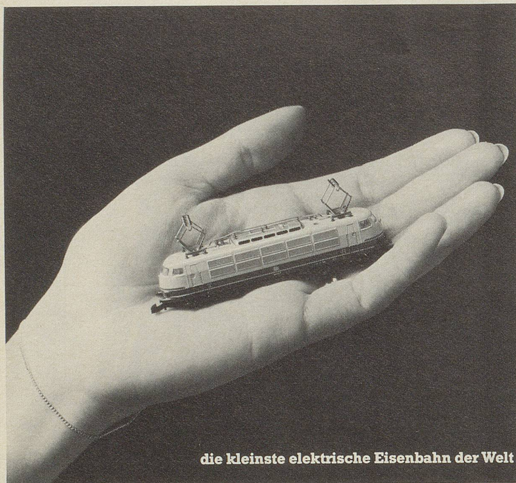
die kleinste elektrische Eisenbahn der Welt

Bei der kleinsten elektrischen Eisenbahn der Welt, der Märklin mini-club, kommen Männer ins Schwärmen. Faszinierend klein und doch eine ausgereifte, vollwertige Modellbahn. Bis ins kleinste Detail. Bis zur echten Oberleitungsfunktion.