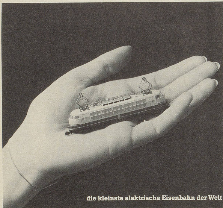
die kleinste elektrische Eisenbahn der Welt

Bei der kleinsten elektrischen Eisenbahn der Welt, der Märklin mini-club, kommen Männer ins Schwärmen. Faszinierend klein und doch eine ausgereifte, vollwertige Modellbahn. Bis ins kleinste Detail. Bis zur echten Oberleitungsfunktion.