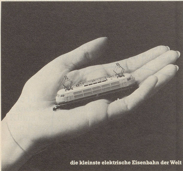
die kleinste elektrische Eisenbahn der Welt

Bei der kleinsten elektrischen Eisenbahn der Welt, der Marklin mini-club, kommen Männer ins Schwärmen. Faszinierend klein und doch eine ausgereifte, vollwertige Modellbahn. Bis ins kleinste Detail. Bis zur echten Oberleitungsfunktion.