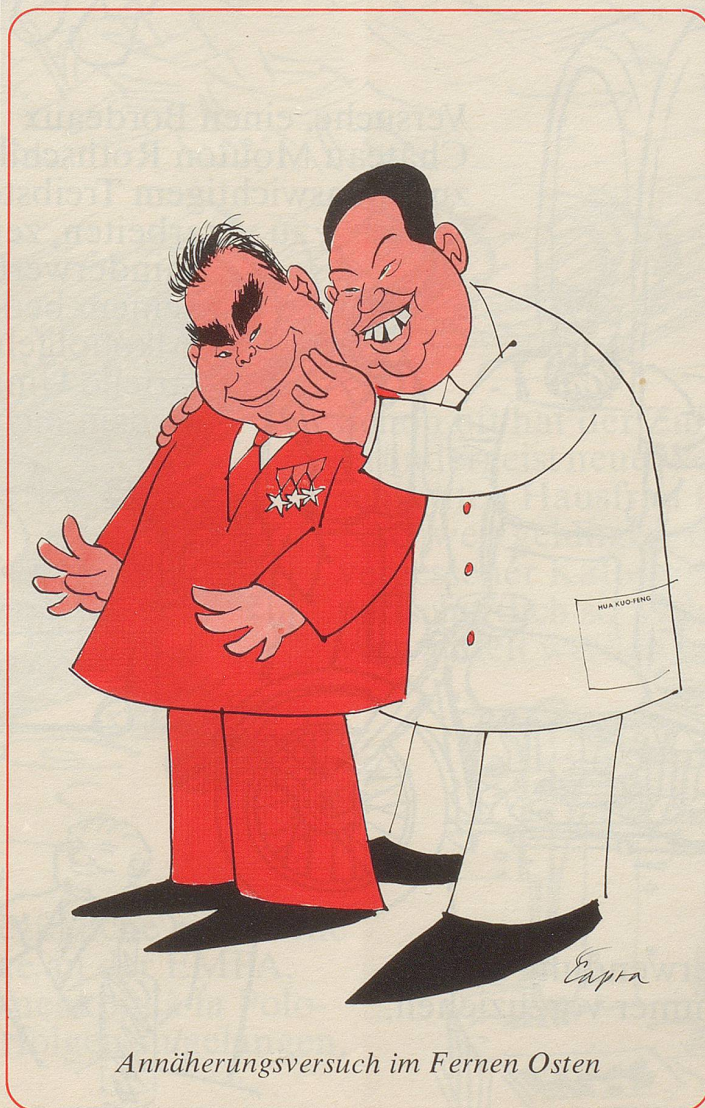
Annäherungsversuch im Fernen Osten

Sehr geehrte Herren Seit mehr als 20 Jahren bin ich Abonnent Ihrer Zeitung. Diese liegt seit dieser Zeit zur Freude der Patienten ständig in meinem Wartezimmer auf. Nun wurde ich verschiedentlich von Patienten aufmerksam gemacht, dass «sogar in Ihrer Zeitung» die Aerzte verunglimpft werden. Da ich unter diesen Umständen den Nebelspalter in meinem Wartezimmer nicht mehr dulden kann, ersuche ich Sie, ab sofort die Zustellung einzustellen.