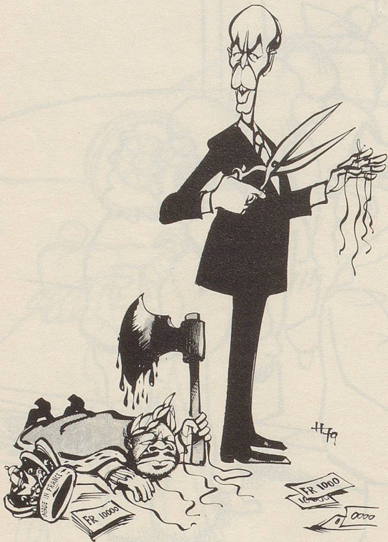
«Kaiser Bokassa? Kenn' ich nicht!»