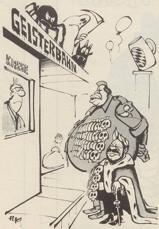
«Gestatten, Amin, Bokassa, haben Sie einen Job für uns?»