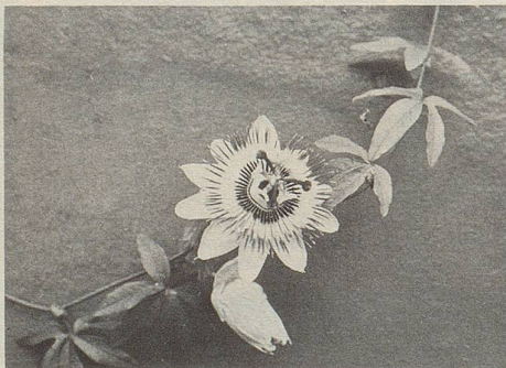
Zu den Kräutern, denen Zeller-Tropfen ihre beruhigende Wirkung verdanken, gehört auch die Passiflora (Passionsblume).