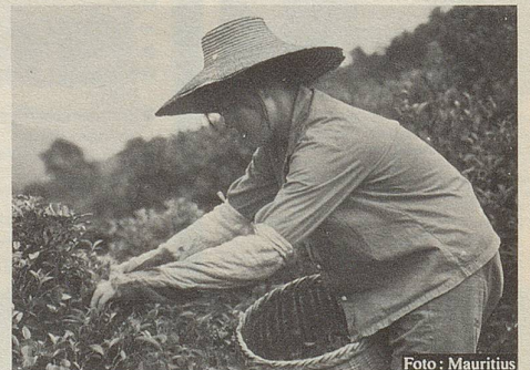
Aus dem Fernen Osten werden viele Heilkräuter importiert.