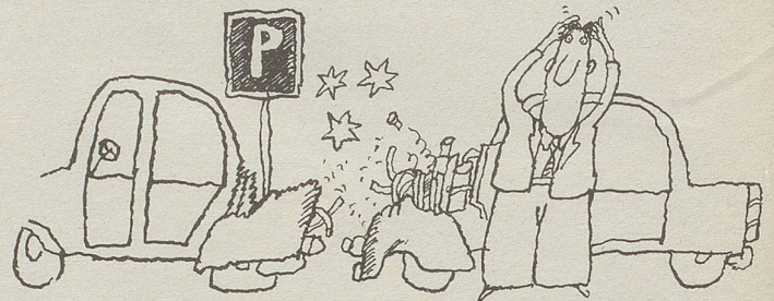
Bei einem richtigen Sicherheitsauto wirken sich schon kleine Parkschäden verheerend aus.