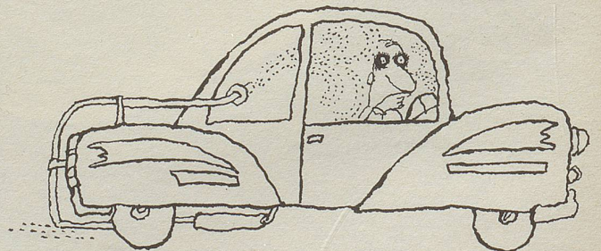
Ein Sicherheitsauto verschont die Umwelt mit Abgasen. Diese werden diskret ins Wageninnere geleitet.