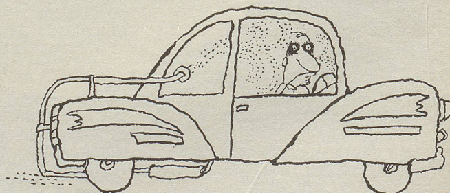
Ein Sicherheitsauto verschont die Umwelt mit Abgasen. Diese werden diskret ins Wageninnere geleitet.