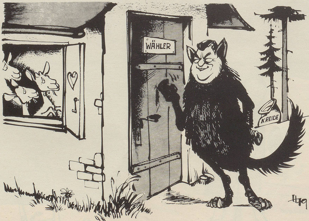
«Aufmachen! Ich bin eure liberale, tolerante Mutti!»