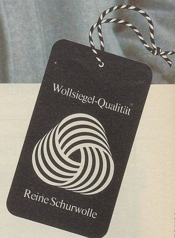
Foto: Wollsiegel-Modelle von Ritex, Zofingen (links); Smarty, Delémont (rechts).

Internationales Wollsekretariat, D-4000 Düsseldorf, A-1011 Wien, CH-8034 Zürich.