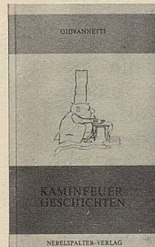
Giovannetti Kaminfeuer Geschichten 95 Seiten Fr. 11.50

Giovannettis «Kaminfeuer Geschichten» sind ausgezeichnete Lektüre für Freunde des Gehaltvollen. Und dort, wo sie entstanden, wollen sie auch gelesen werden: am Kamin. Wobei Kamin nicht wörtlich genommen werden muss. Es genügt eine stille Ecke.