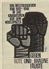
Bö und Mitarbeiter Gegen rote und braune Fäuste 342 Zeichnungen aus den Jahren 1932 bis 1948 Taschenbuch-Mehrfachband 352 Seiten Fr. 10.80

Mit vordergründigem Charme und hintergründigem Witz lässt Wolf Barth Bilder sprechen – federleicht und gedankenschwer: Spruchweisheit springt ins Auge.