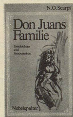
N. O. Scarpi Don Juans Familie Geschichten und Amouresken Illustrationen Helmut Knorr 184 Seiten Leinenband Fr. 19.80

53 Gedichte ohne Vor- und Nachwort, treffend unterstrichen durch Illustrationen von Barth. Menschsein ist ein harter Beruf und doch zuweilen heiter. Vergnügliches Bewusstmachen des Tretmühlendaseins, aufgelockert durch Gedanken und Wortspielereien.