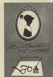
Bö Elsa von Grindelstein und ein gewisser Bö 68 Gedichte von Carl Böckli 72 Seiten Fr. 5.80

Der Zeitgenosse jener Jahre trifft sich mit dem jungen Betrachter dieses Buches in der gemeinsamen Einsicht, dass die Verharmlosung nur eine trügerische Ruhe beschert. Ein Buch, das heute noch eine Mahnung darstellt.