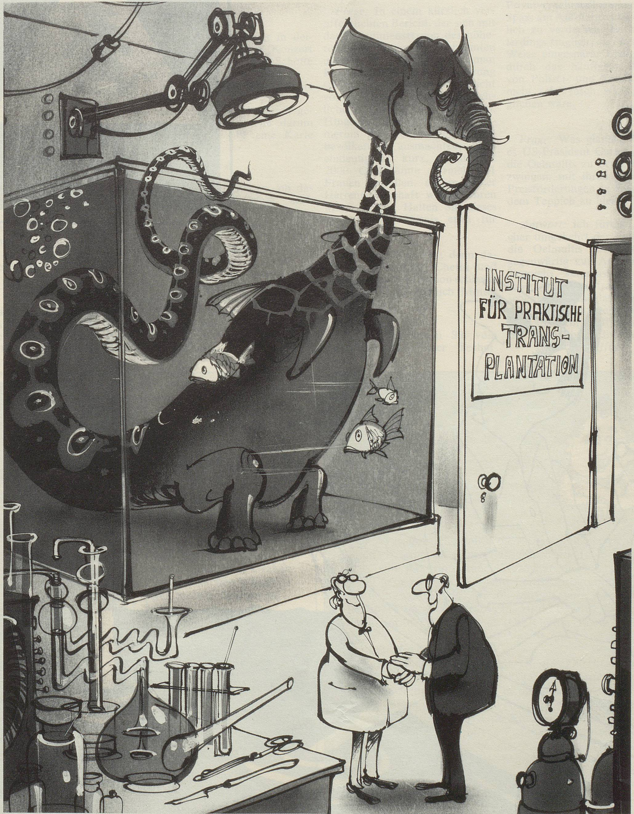
«Der Gemeinderat von Loch Ness freut sich, Ihnen die Ehrenbürgerschaft verleihen zu dürfen!»