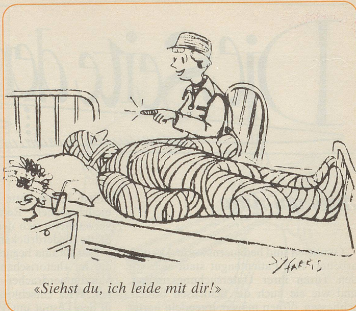
«Siehst du, ich leide mit dir!»